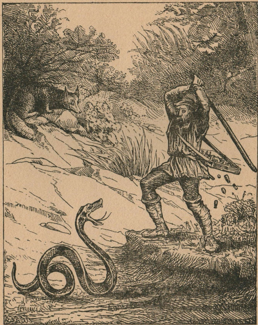
De kramer sloeg er duchtig op los (bladz. 41)

— Neen, neen ! Al dien uitleg kan ik wel missen ! Doe het mij even voor, dat is veel duidelijker !